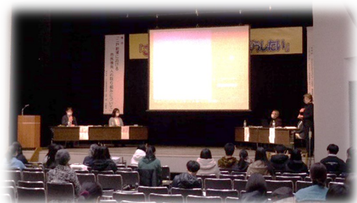
二戸地区権利擁護市民セミナー 風景